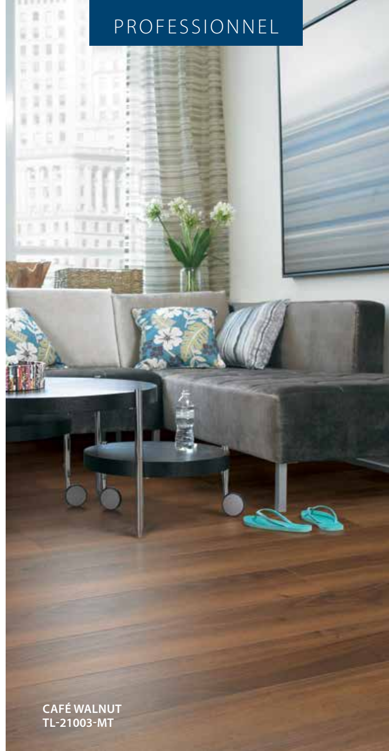
CAFÉ WALNUT TL-21003-MT