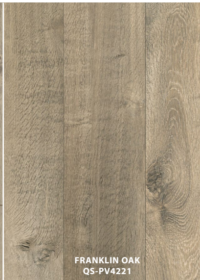
FRANKLIN OAK QS-PV4221