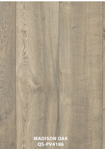
MADISON OAK QS-PV4186