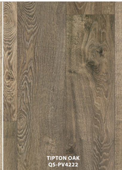
TIPTON OAK QS-PV4222