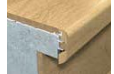
Nez de marche encastré*

*Une sous-base d'aluminium est requise pour les installations du nez de marche encastré.