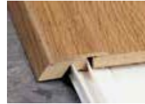
Moulure de réduction