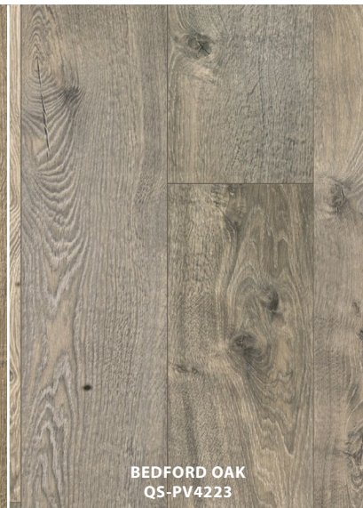
BEDFORD OAK QS-PV4223