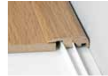
Nez carré - sert à dissimuler l'espace d'expansion sur tout le périmètre de la pièce.