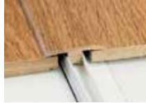
Moulure en T

Moulure en T, à nez carré, de réduction, et nez de marche encastré dans UN seul profil.