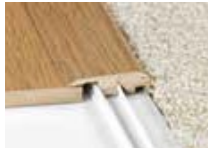
Nez carré - sert à la transition avec un tapis.